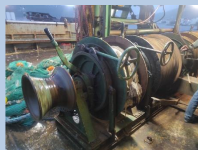
Εικόνα 4: Η εγκατάσταση του βαρούλκου στο πρυμναίο κατάστρωμα.