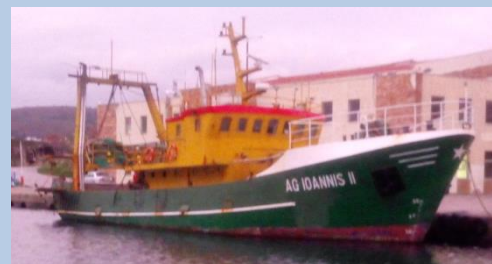
Εικόνα 1: Α/Κ «ΑΓΙΟΣ ΙΩΑΝΝΗΣ ΙΙ».