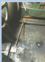
Εικόνα 3: Ποδοχειριστήριο.